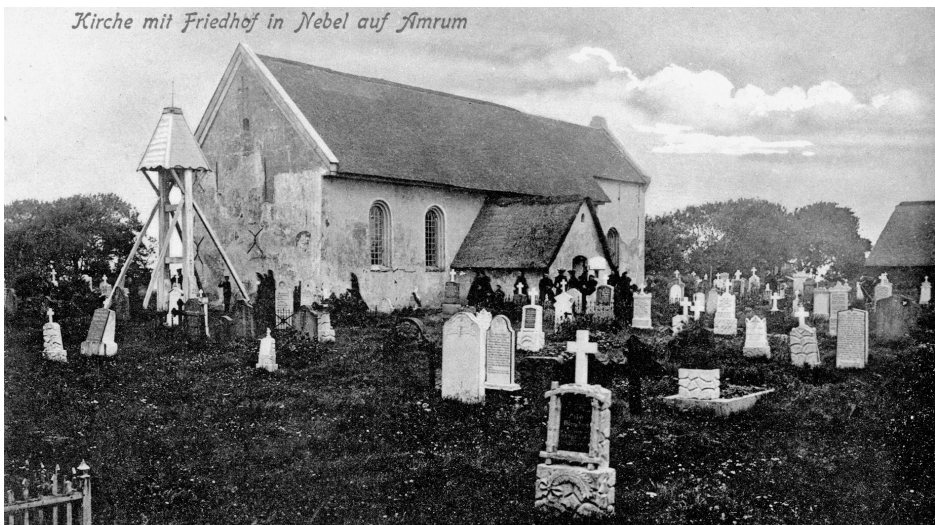
Amrumer Friedhof, Postkarte um 1900

In der Raumsoziologie unterscheidet man zwischen dem Ort als konkreter Stelle auf der Erde und dem Raum,