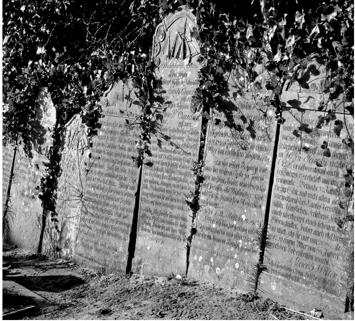
Grabsteine am Nordwall des Nebeler Friedhofs, 2009

die Bedeutung des Ortes. Neue Familien eigneten sich den Ort an, verbanden sich mit ihm und gaben ihm ihre eigene Bedeutung. Manchmal bewahrte man die Verbindung zu den alten Familien, indem angeheiratete Familien einzelne alte Grabsteine stehen ließen, oder die alten Grabsteine wurden, wie es auf Amrum seit den 1880er Jahren geschah, in besonderen Bereichen oder an der Friedhofsmauer gesammelt und bewahrten dort die Verbindung zur Vergangenheit. Es ist klar, dass dies alles nur in einer Welt funktionierte, wo Familien über viele Generationen an einem Ort lebten. Industrialisierung und moderne Mobilität haben diese Zusammenhänge zerstört und eine neue Grabkultur geschaffen, da Familiengräber ihren Sinn verlieren, wenn alle Nachkommen weggezogen sind und den Ort verlassen haben. Das individuelle Einzelgrab, das man heute sieht, ist ein