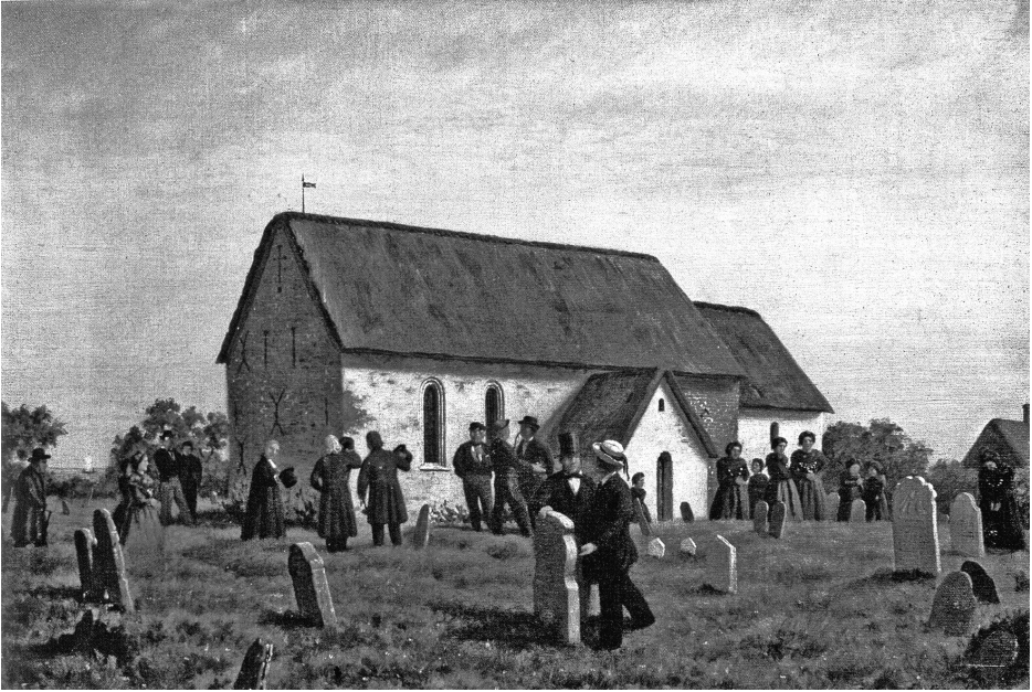
Kirche und Friedhof in Nebel 1864, Gemälde von Carl Ludwig Jessen (Museum Kunst der Westküste, Alkersum/Föhr)

(mehr) existierender Wohlstand vorgegaukelt, der vielleicht auch die Kreditwürdigkeit befördern sollte.