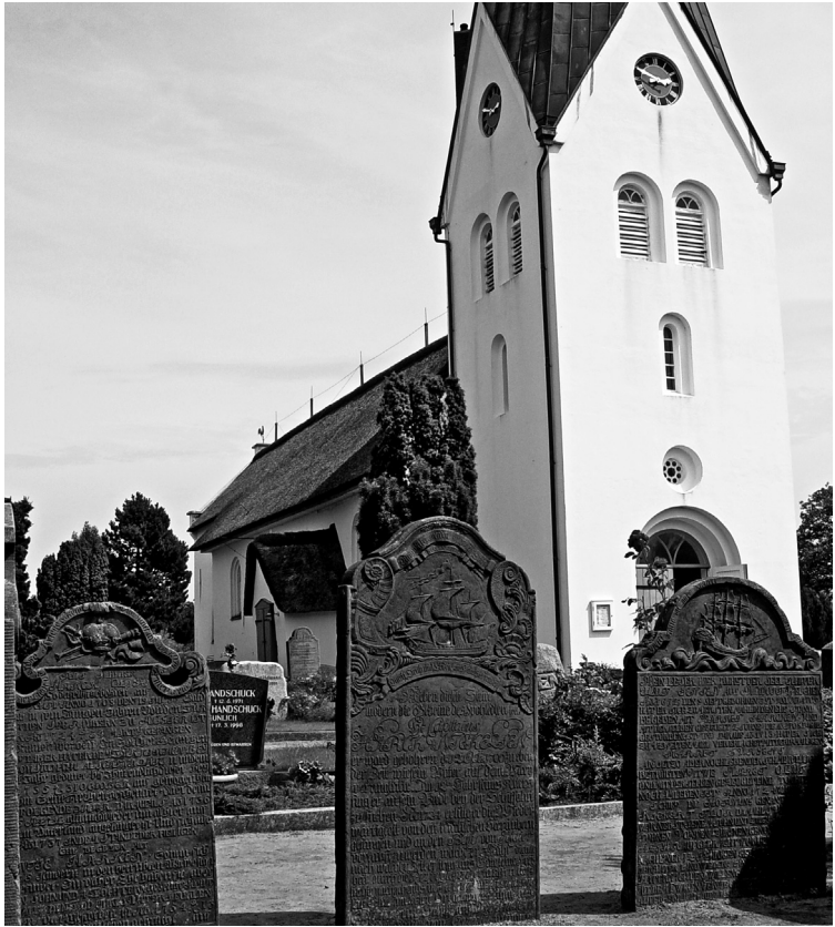
Seefahrergrabsteine vor der Sankt Clemens in Nebel, 2007

ben, der von einem Wall eingegrenzt ist. Heute hat die Kirche im Westen einen markanten Turm, doch ist dieser erst im Jahre 1908 gebaut worden. 6 Noch etwa 150 alte Grabsteine von vor 1900 finden sich auf dem Friedhof. 28 dieser alten Grabsteine sowie einige neuere zeigen jeweils ein Schiffsbild. 7 Es gibt sowohl ursprünglich liegende, heute aber aufgestellte Grabplatten aus dem 17. Jahrhundert als auch stehende Grabsteine aus dem 18. und 19. Jahrhundert, sogenannte Stelen, von denen einige beidseitig mit Inschriften und Bildern versehen sind. Hinzu kommen einige kleinere Fliesen mit sehr kurzen und oft abgekürzten Texten. Die