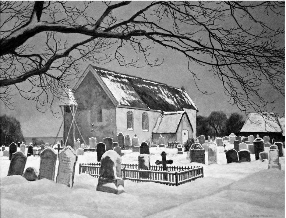
Kirche und Friedhof in Nebel, Zustand um 1900, Gemälde von Magnus Weidemann 1941 (Nordseemuseum Nissenhaus, Nr. 135)

Nickelsen, ihm gegenüber links am Wege Hark Olufs. 6