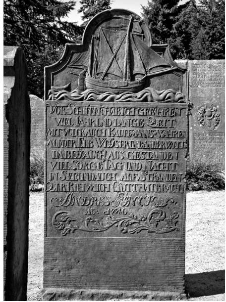
Vorder- und Rückseite des Steins von Andres Finck, 2005 und 2009

handelt es sich aber wiederum um etwas Positives im Sinne des zugrunde liegenden Weltbildes. Alle Daten werden in der Regel in einen christlichen Heilzusammenhang gestellt und erhalten damit einen Sinn.