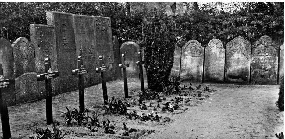
Die historischen Grabsteine wurden zunächst in der nordwestlichen Ecke des Friedhofs aufgestellt. Rechts steht heute das Kriegerehrenmal. Postkarte von vor 1945.

Die Amrumer St. Clemens-Kirche liegt in dem Dorf Nebel ungefähr in der Mitte der Insel. Die strohgedeckte Kirche stammt aus dem 13. Jahrhundert und ist von einem Friedhof umge-